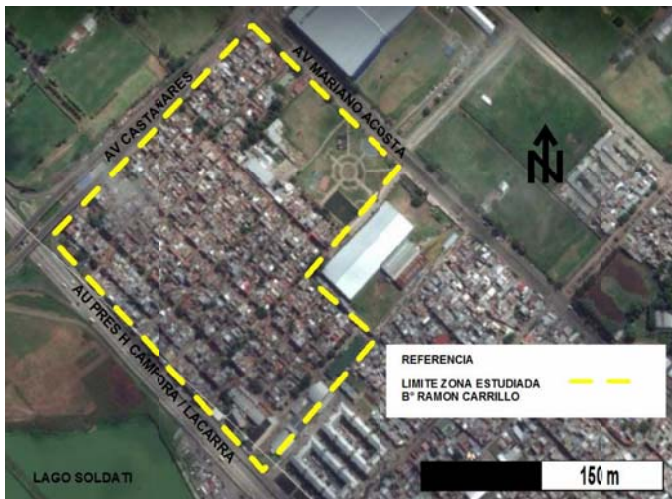
Figura 1. Ubicación del barrio Ramón Carrillo.