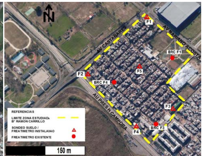
Figura 2. Ubicación de los sitios de suelos y freáticos.

En este contexto de generalizado deterioro urbano, el gobierno de la ciudad declaró la situación de emergencia ambiental y edilicia del conjunto Soldati (agosto de 2001) que incluye el barrio Ramón Carrillo (3).