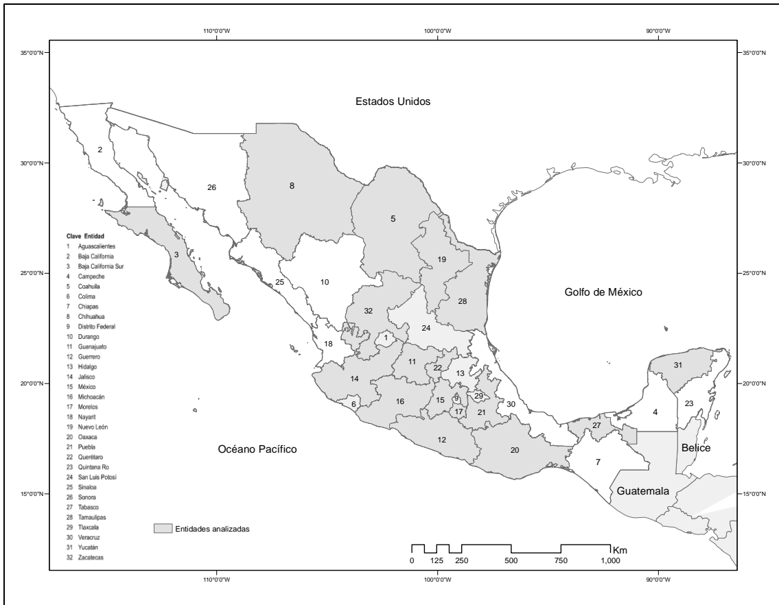
Figura. N° 2 Estudios estatales con base en la asimilación económica del territorio