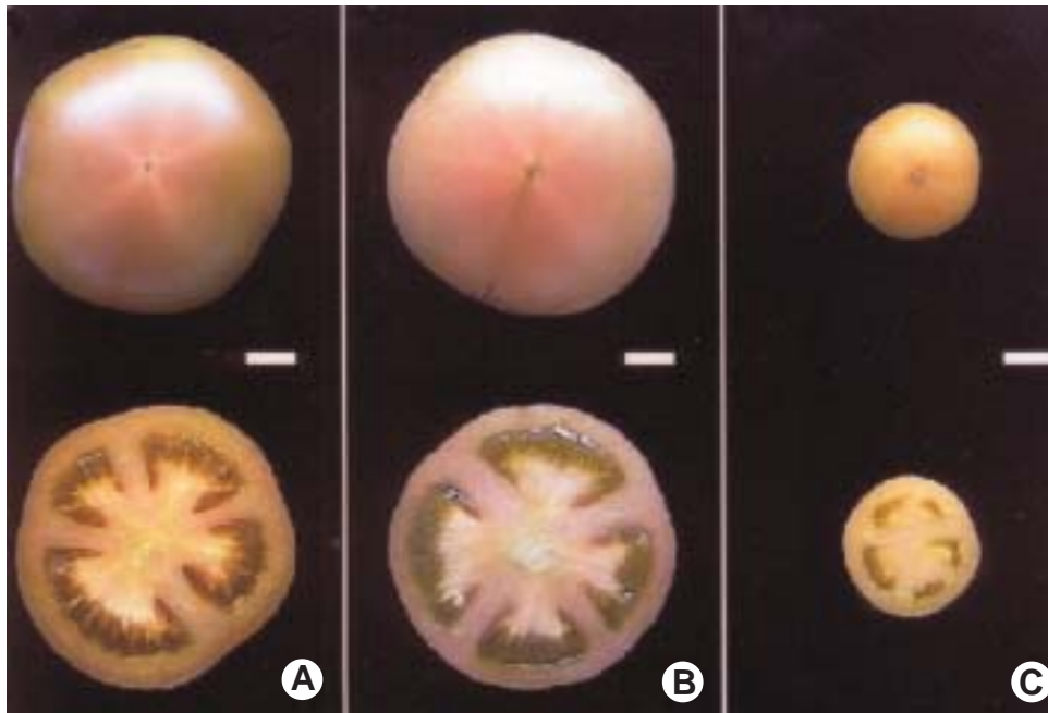
Aspecto general y corte transversal de frutos del híbrido Fortaleza F1 obtenidos por autopolinización (A), aplicación de 100 ppm de los fitorreguladores: \beta -NOA (B) y AG3 (C) a 0 dpa. Barra = 1 cm.

A nivel morfológico, la aplicación de \beta -NOA permitió obtener frutos partenocárpicos de aspecto similar a los polinizados con un importante desarrollo de placentas y óvulos. El tratamiento con AG3, en cambio, indujo frutos de menor tamaño, con escaso desarrollo de placentas y ausencia de óvulos.