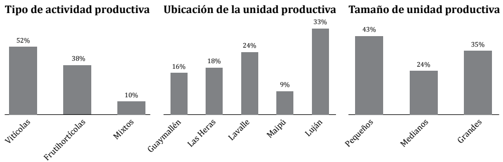
Figura 3. Características del muestreo.