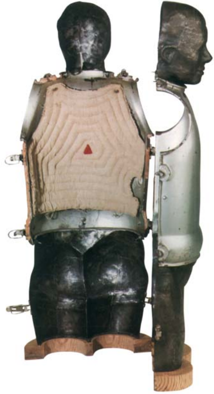
JUANA DE ARCO Hierro batido y soldado (44 x 170 cm)