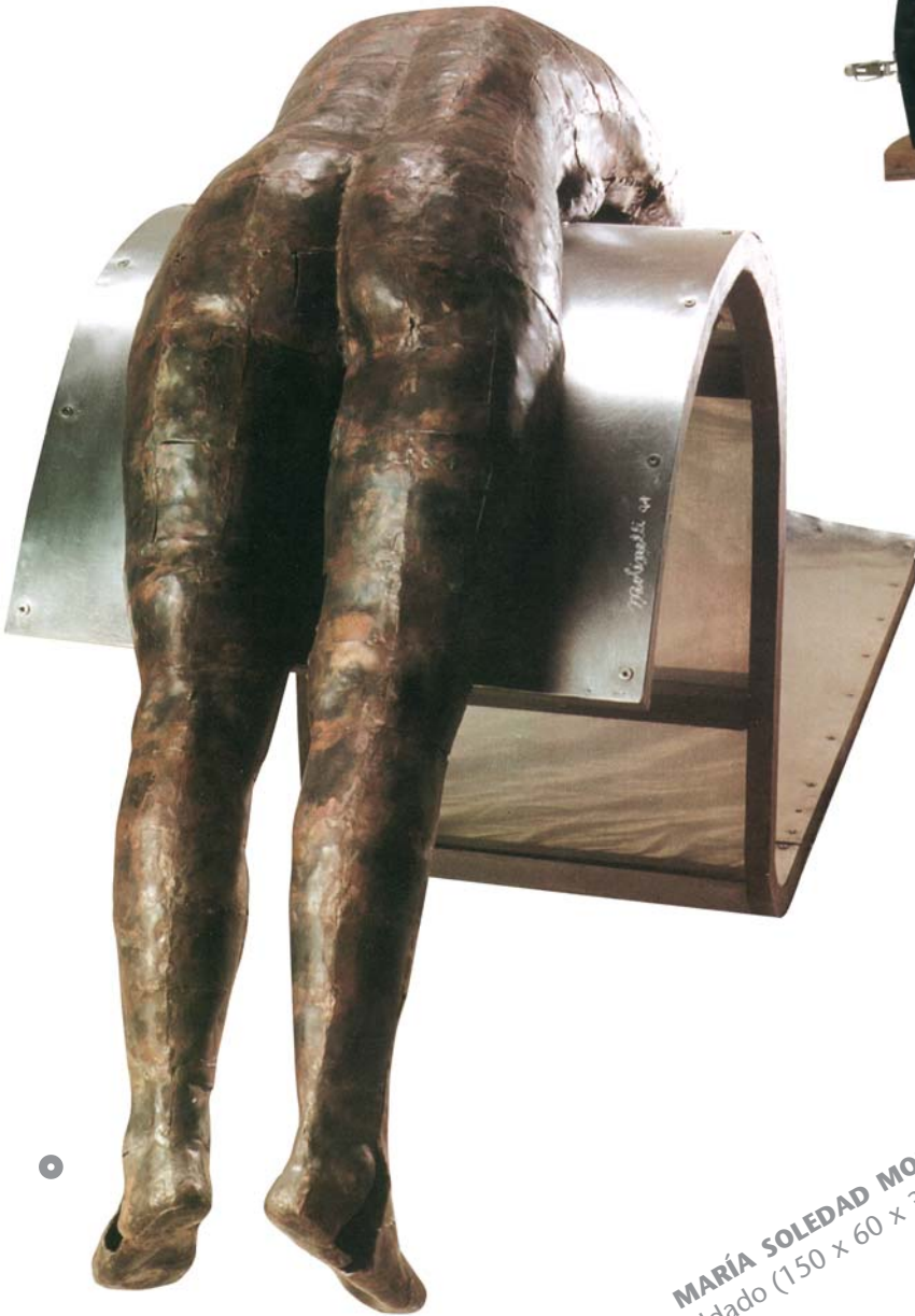
MARÍA SOLEDAD MORALES Hierro batido y soldado (150 x 60 x 300 cm)