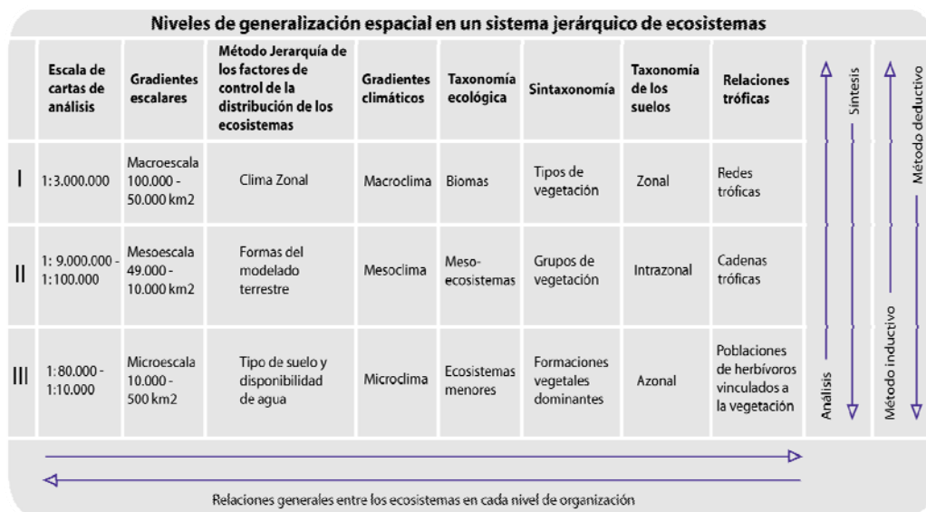
Fig. 1- Modelo conceptual. Alessandro, M. 2003

Los resultados de la aplicación fueron, a saber: