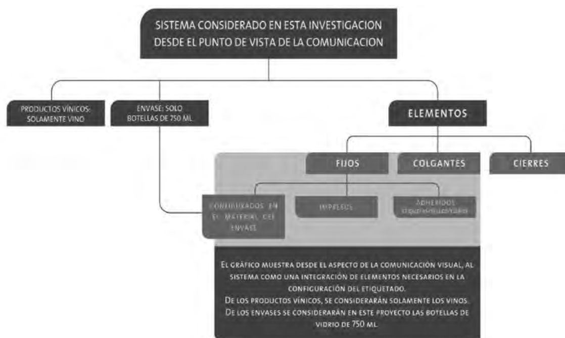
Figura 1: La figura muestra el cuadro del sistema de etiquetado

Pudo observarse, dentro del área de la comunicación visual, la existencia del sistema etiquetado que integra diferentes subsistemas interconectados entre sí (vino, envase, cesía, elementos de la botella y del etiquetado), los cuales cumplen una fun-