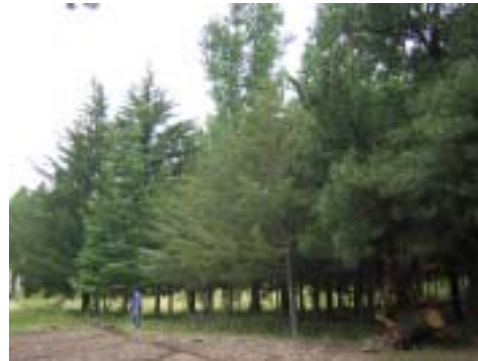
Vista general del ensayo