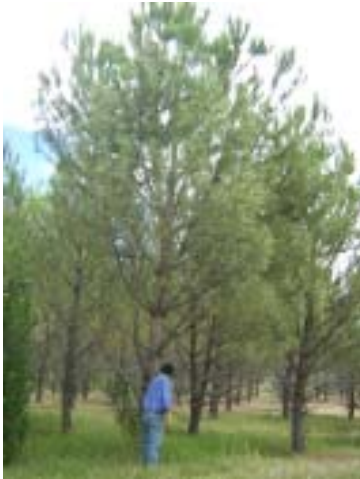
Pinus pinea L.

A partir de experiencias y observaciones locales de árboles ya existentes, la consulta y búsqueda bibliográfica y tomando en cuenta las analogías climáticas y/o edáficas de las zonas de origen con la localidad donde se instalarían las parcelas, se decidió comenzar la primera etapa de adaptación con las siguientes especies: Pinus pinea L., Pinus halepensis Mill. y Cupressus arizonica Greene.