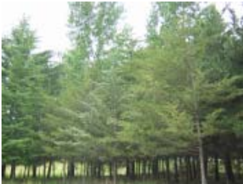
Cupressus arizonica Greene