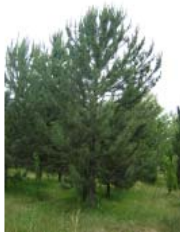
Pinus halepensis Mill.