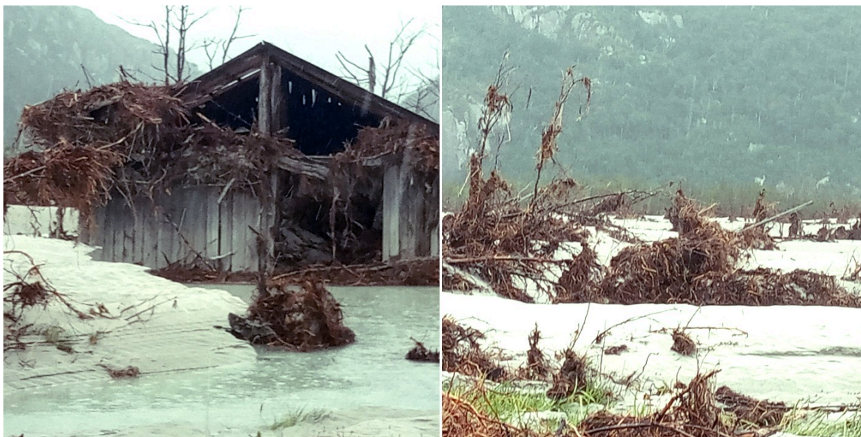
Imagen 3: Inundación sector Valle Huemules, GLOF año 2022.

“Esos cambios así, uno no sabe cómo enfrentarlos, porque todos los años como que vienen distintos, por ejemplo este año el invierno fue largo, muy frío como era hace muchos años y el año pasado fue un invierno corto y bueno” (Poblador 5).