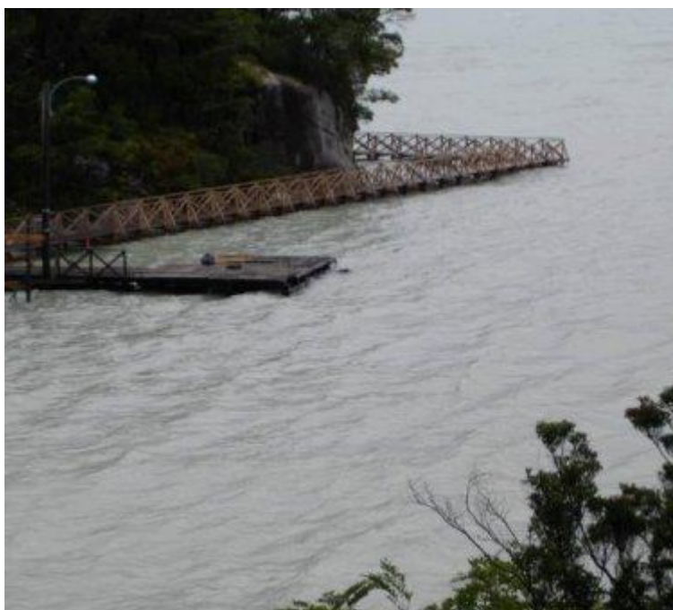
Imagen 2: Nivel del agua Caleta Tortel provocado por el vaciamiento del Lago Cachet II, año 2008.

pasarelas. Eso después, siguió pasando como 2 veces al año más o menos, como que empezó a ser normal después” (Pobladora 4)