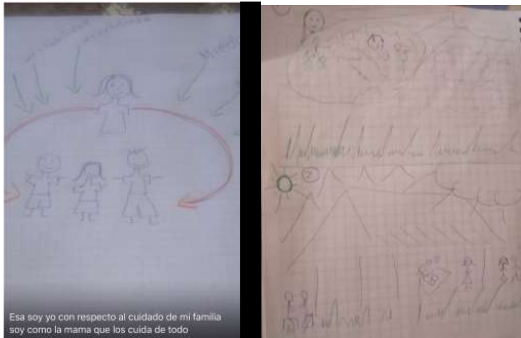
Figura N° 2 - 6 Fotos

A continuación, presentamos algunos dibujos representativos de las diversas temáticas, representaciones, emociones y cartografías expresadas en los encuentros del grupo focal de mujeres: