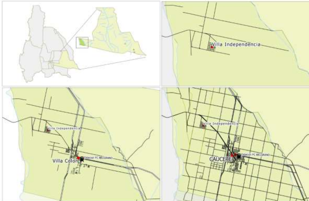
Ilustración 4. Evolución histórica del área urbana de Caucete.

alternativa de la provincia de San Juan. Esta propuesta busca superar las asimetrías territoriales fortaleciendo líneas de trabajo según el perfil y las potencialidades de cada ciudad. Desde esta perspectiva las fronteras trascienden lo meramente administrativo para comprender los procesos que a otro nivel de escala y análisis se producen en la relación local-global.