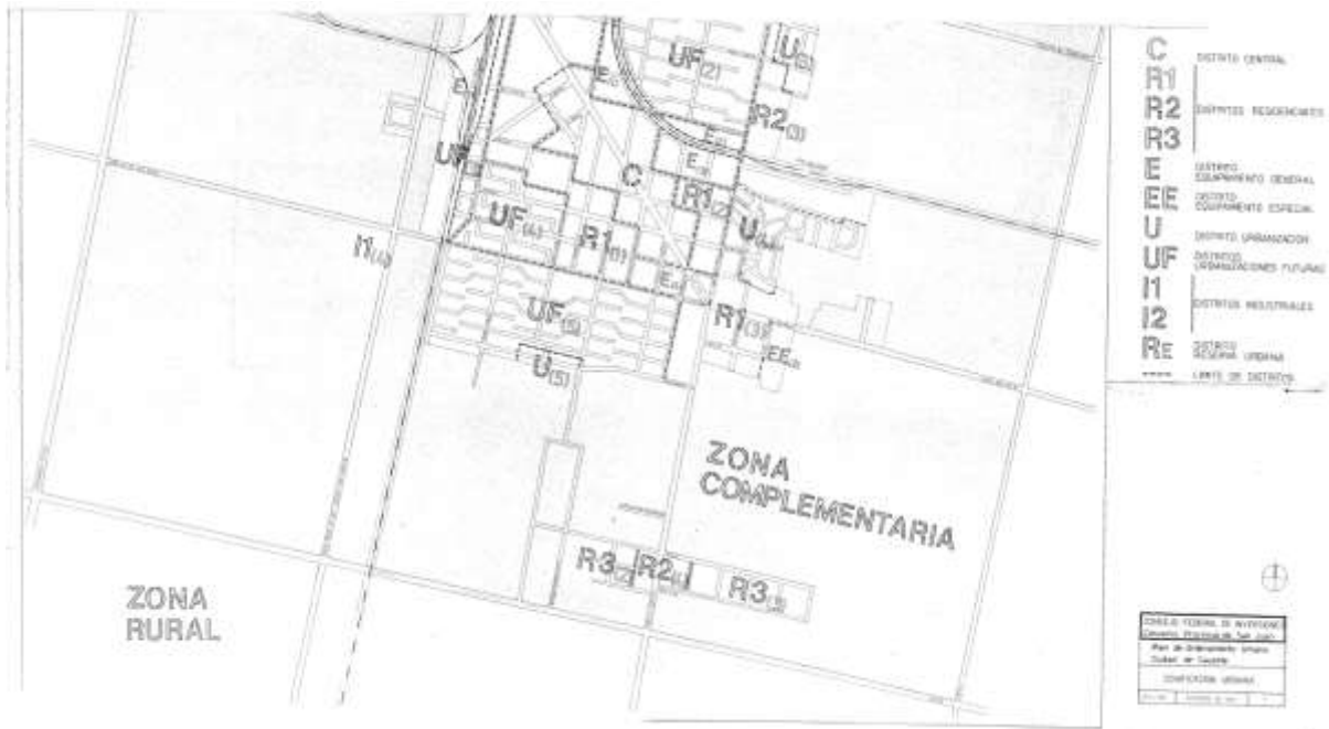
Ilustración 2 - Zonificación propuesta por el Plan Director Urbano de la Ciudad de Caucete (1979)

terrenos intangibles para proyectos de cualquier tipo de división de tierras con fines residenciales 2 (ver Ilustración 2). Las nuevas tendencias en la gestión territorial, sin embargo, buscan crear herramientas que guíen el desarrollo, no lo prohíban; y que permitan generar centros urbanos dinámicos basados en usos mixtos, utilizando consideraciones de capacidad ambiental y desarrollo sostenible. (Witherspoon 1976; Naredo 2003; Carazo 2008; ONU-Habitat 2014)