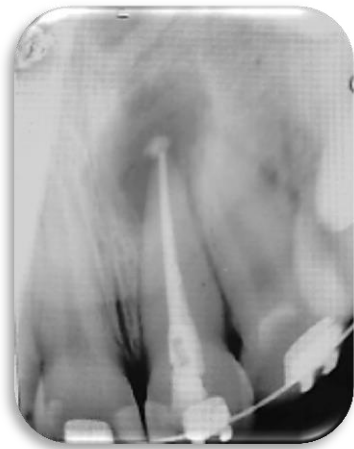
Fig 2. Radiografía postoperatoria tratamiento de endodoncia. Julio 2018.