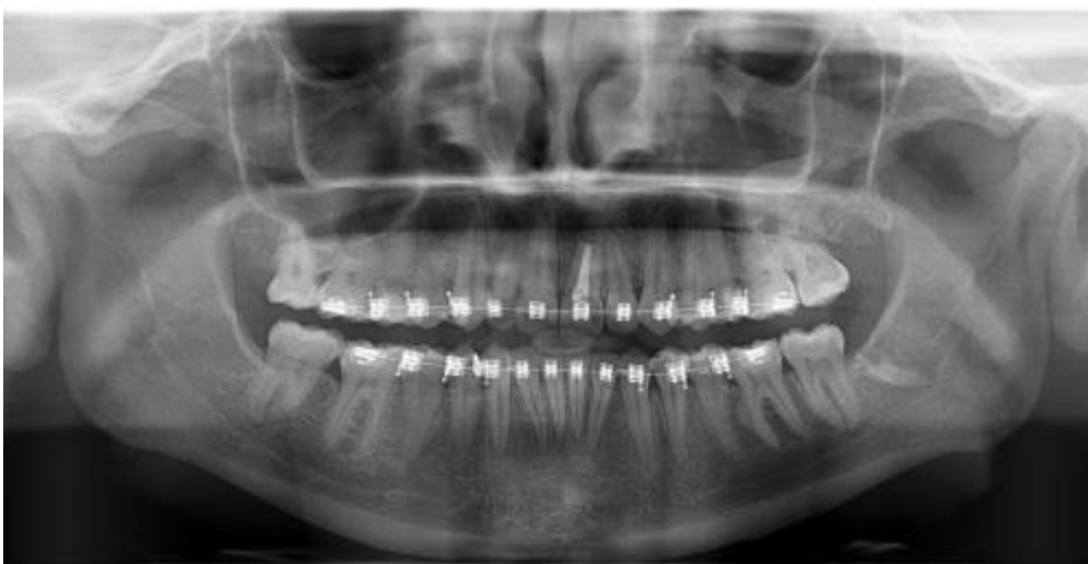
Fig. 11. Control radiográfico a los 6 meses de la cirugía

A los 6 meses de la cirugía se realizó una radiografía panorámica de control. (Fig.11).