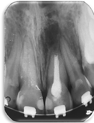
Fig. 13. Control radiográfico. Marzo 2020.