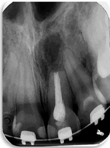
Fig.12. Control radiográfico. Octubre 2019.

A los 10 meses de haber realizado la cirugía se tomó la primera radiografía periapical. En la radiografía se pudo observar que la lesión ya no es tan radiopaca como en la imagen postoperatoria inmediata, siendo esto compatible con el inicio de la reparación (Fig. 12). El segundo control radiográfico se realizó 14 meses posteriores a la cirugía (Fig. 13).