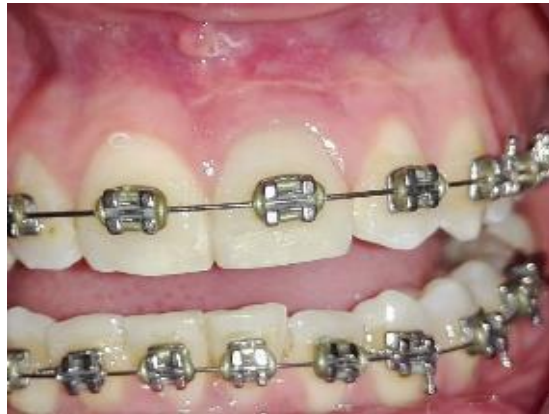
Fig.10. Segundo Control. Febrero 2019.

puntos de sutura (Fig.9). El siguiente control se realizó habiendo transcurrido un mes desde la intervención quirúrgica. Al examen clínico se observó una correcta cicatrización de los tejidos blandos y la ausencia de fistulas, se realizaron test de sensibilidad en el elemento 22 el cual respondió positivamente (Fig.10).