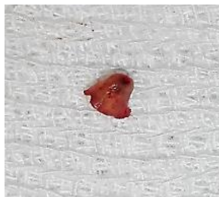
Fig. 6. Ápice radicular seccionado

Para la obturación retrograda se confecciono una cavidad de 2mm aproximadamente con puntas de ultrasonido para microcirugía y se rellenó con MTA® (Angelus, Brasil). Fue necesaria la toma de una radiografía apical (Película Dental Intraoral Kodak Velocidad E (E Speed)) con el objetivo de evaluar la apicetomía, la obturación retrograda y asegurarse la remoción de la gutapercha que se encontraba