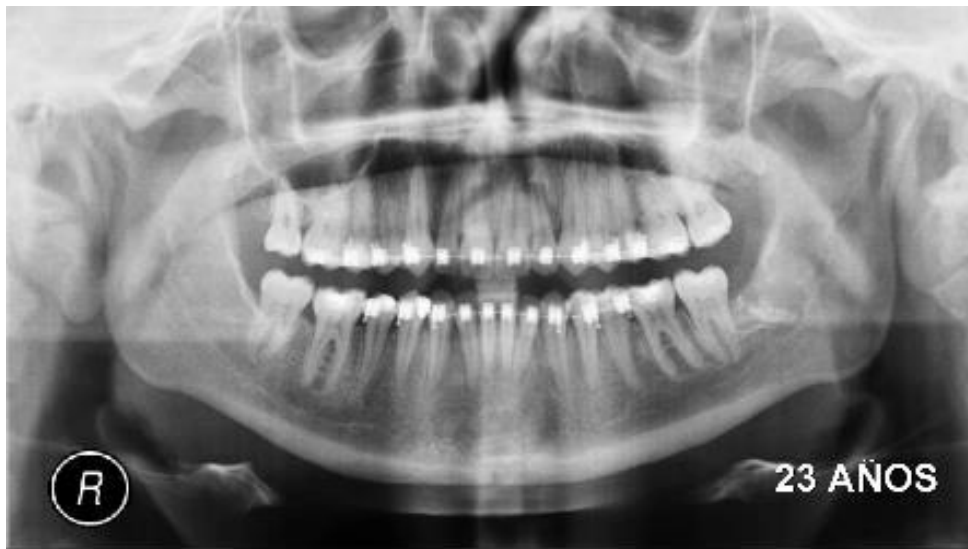
Fig.1. Radiografía panorámica preoperatoria.

Al examen radiográfico observamos una lesión radiopaca de gran tamaño alrededor del ápice del elemento 21 (Fig.1).