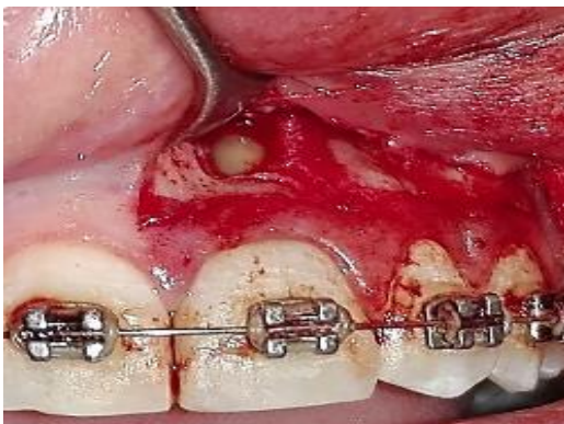
Fig. 5. Decolado que muestra la fenestración ósea a nivel apical, exponiendo el ápice radicular.

El curetaje de la lesión se realizó con una cureta de Lucas N°88 (Hu Friedy, USA). Luego se procedió a realizar la apicectomía. El ápice radicular fue eliminado con puntas de ultrasonido troncocónica diamantada, E 5D (Woodpecker, China) (Fig. 6).