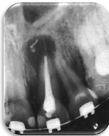
Fig 4. Radiografía postoperatoria retratamiento de conducto. Noviembre 2018.

En el momento que se desobturó el conducto se produjo la extravasación de gutapercha hacia el sitio de la lesión, quedando una masa de gutapercha inmersa en la lesión periapical. Luego se colocó nuevamente hidróxido de calcio (Tedequin S.R.L. Industria Argentina) durante dos semanas y se realizó el retratamiento de conducto donde se obturo con la técnica de impresión apical (Fig.4).