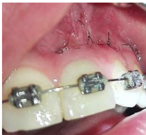
Fig. 9. Control a las 72 horas para remover los puntos de sutura

Se le indicaron al paciente los cuidados postoperatorios, se recomendó suspender el tratamiento de ortodoncia por 3 meses y se lo cito a las 72 horas para remover los