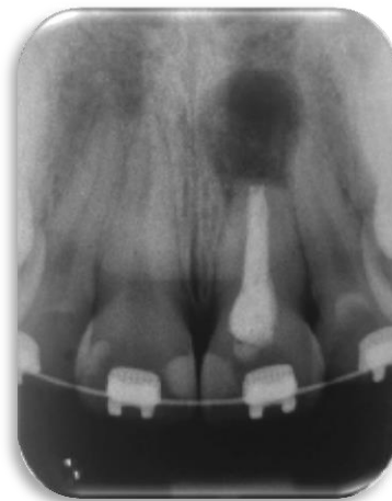
Fig. 8. Radiografía postoperatoria. Diciembre 2018.

(Película Dental Intraoral Kodak Velocidad E (E Speed)), la cual se va a tener como referencia al momento de realizar los controles posteriores (Fig.8)