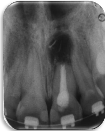
Fig. 7. Radiografía que muestra los restos de gutapercha que no han sido eliminados por completo.

en la zona de lesión (Fig. 7). En la radiografía se observaron restos de gutapercha en la lesión, por lo que se cureteó nuevamente hasta eliminar por completo la gutapercha. Luego se procedió con la reposición del colgajo y la sutura. Se utilizó una sutura de nylon monofilamento de color negro 6-0 (Surgikal, Cardiopack Argentina S.A. Argentina). Al finalizar la cirugía se tomó una radiografía periapical