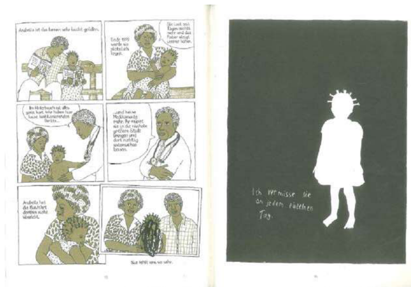
Abbildung 1 Weyhe, 2016: 93.

von natürlichen Bildern in Bezug auf Schatten, Spiegelungen oder Abdrücken. Weyhe nutzt diese beispielsweise, um den Tod, das Fehlen einer Person im Leben anderer auf sehr eindrücklicher Weise Ausdruck zu verleihen (vgl. Abbildung 1 bzw. Weyhe, 2016: 93).