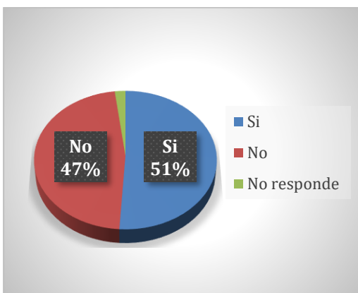
Grafico 2: conocimiento sobre ley de Parto Respetado

Como se puede apreciar un poco más de la mitad de las personas entrevistadas (51%) refieren conocer “algo” sobre la ley, pero cuando se les pide que especifiquen mencionan sólo el derecho de la madre a estar acompañada, la libre elección de posición en el parto. O, en su defecto, relatan situaciones de violaciones de la ley y de violencia obstétrica. El restante 47% nunca ha escuchado acerca de la ley ni tampoco sobre el concepto de parto respetado.